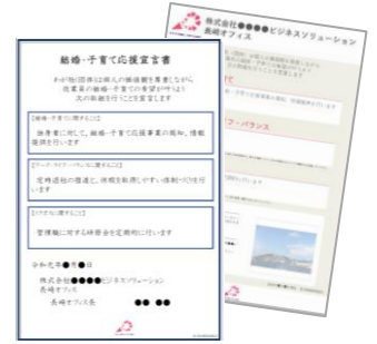
※1 宣言書・チラシのイメージ